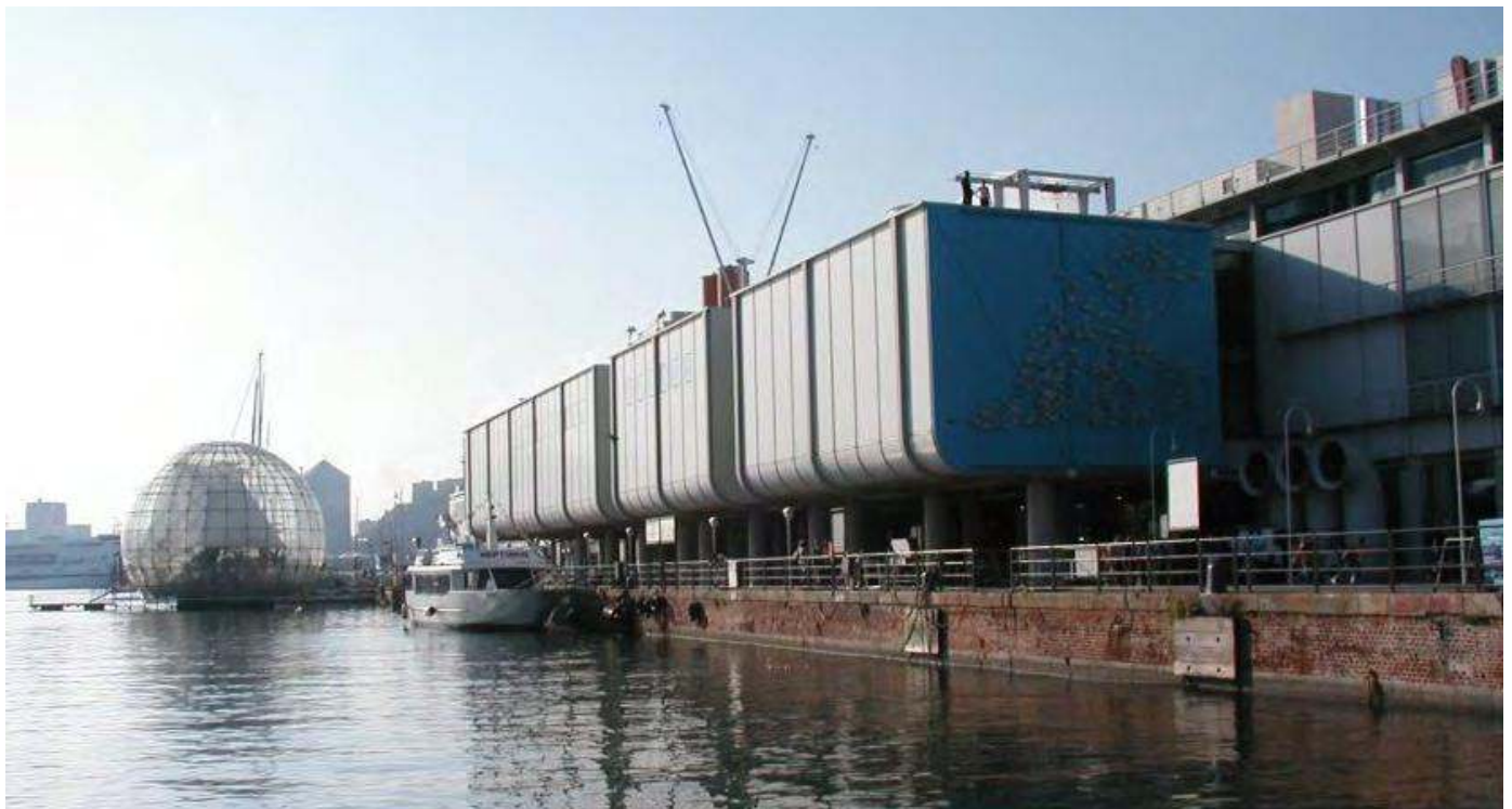
Acquario di Genova e Sfera di Renzo Piano

DeA Capital SpA, fondata nel 2000 a Milano, appartiene al Gruppo De Agostini e si occupa di investimenti in private equity e nel settore dell'alternative asset management.